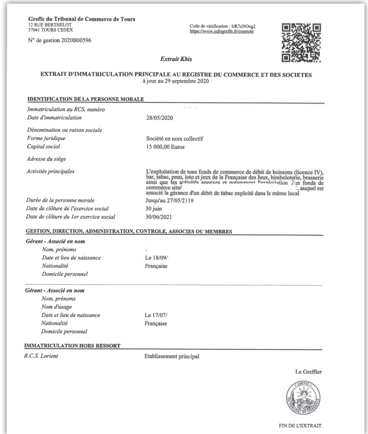
Extrait K-BIS de moins de 3 mois